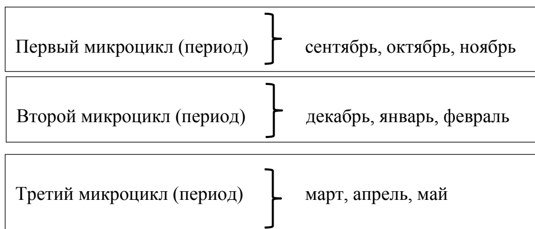
Рис.2 «Деление задач на микроциклы».

Задачи комплексно-тематического планирования - это поэтапные «шаги» к достижению поставленной цели. Они объединены по направлениям (образовательным областям). (Приложение №1). Задачи по созданию комплексно-тематического планирования определены в основной образовательной программе МКДОУ № 97 и разбиты на три микроцикла (периода). (рис. №2).